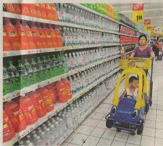
ATAS: Penggunaan troli untuk membataskan pergerakan anak-anak hanya sesuai untuk lokasi tertentu sahaja.

Keputusan pasangan itu bagaimanapun gagal apabila mereka mendaftari di Malaysia belum ada produk abah-abah keselamatan yang dipakainya pada bahagian dada si kecil. Tanpa