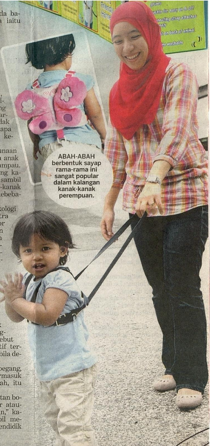
ABAH-ABAH berbentuk sayap rama-rama ini sangat popular dalam kalangan kanak-kanak perempuan.

“Jadi, abah-abah keselamatan boleh menjadi pilihan terakhir ataupun hanya sebagai sokongan,” katanya kepada Kosmo! sambil menekankan kepentingan mendidik anak menerusi perbualan.